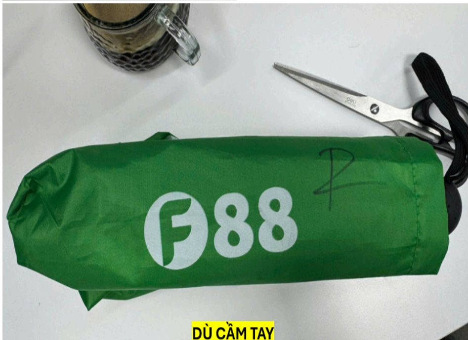
DÙ CẦM TAY